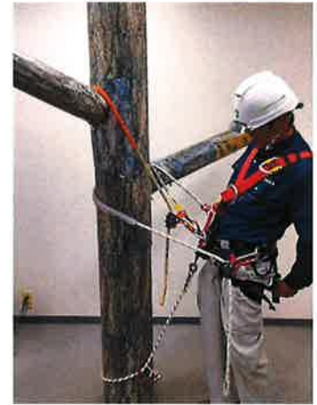
【ランヤードを掛けた時のイメージ】